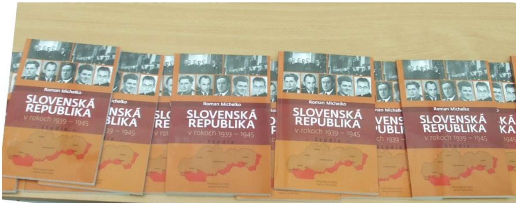
Foto 1: Publikácia SLOVENSKÁ REPUBLIKA v rokoch 1939 - 1945 - štúdie - čaká na svojich čitateľov