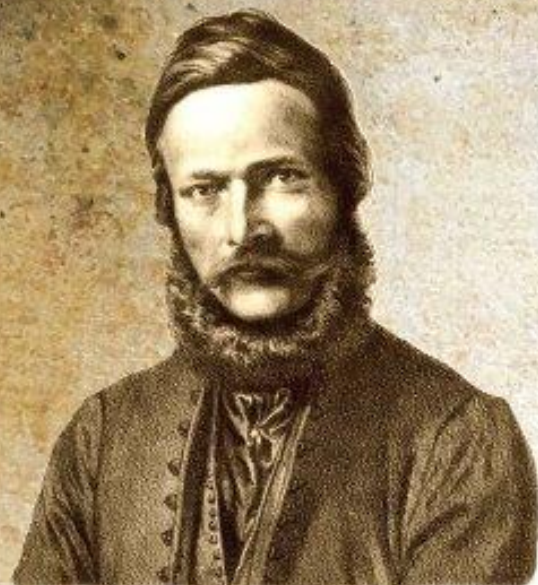
Ľudovít Velislav Štúr (1815 - 1856)

2. marca 1849 prechádzali obcou Budimír Jozef M. Hurban, Ľudovít V. Štúr a dobrovoľníci Slovenského národného vojska.