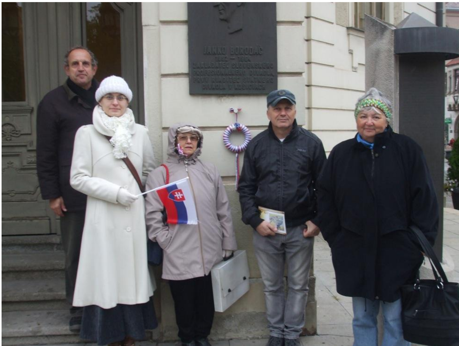
Foto 3: Matičnú pochôdzku zakončili košíckí matičiari pri Štátnom divadle