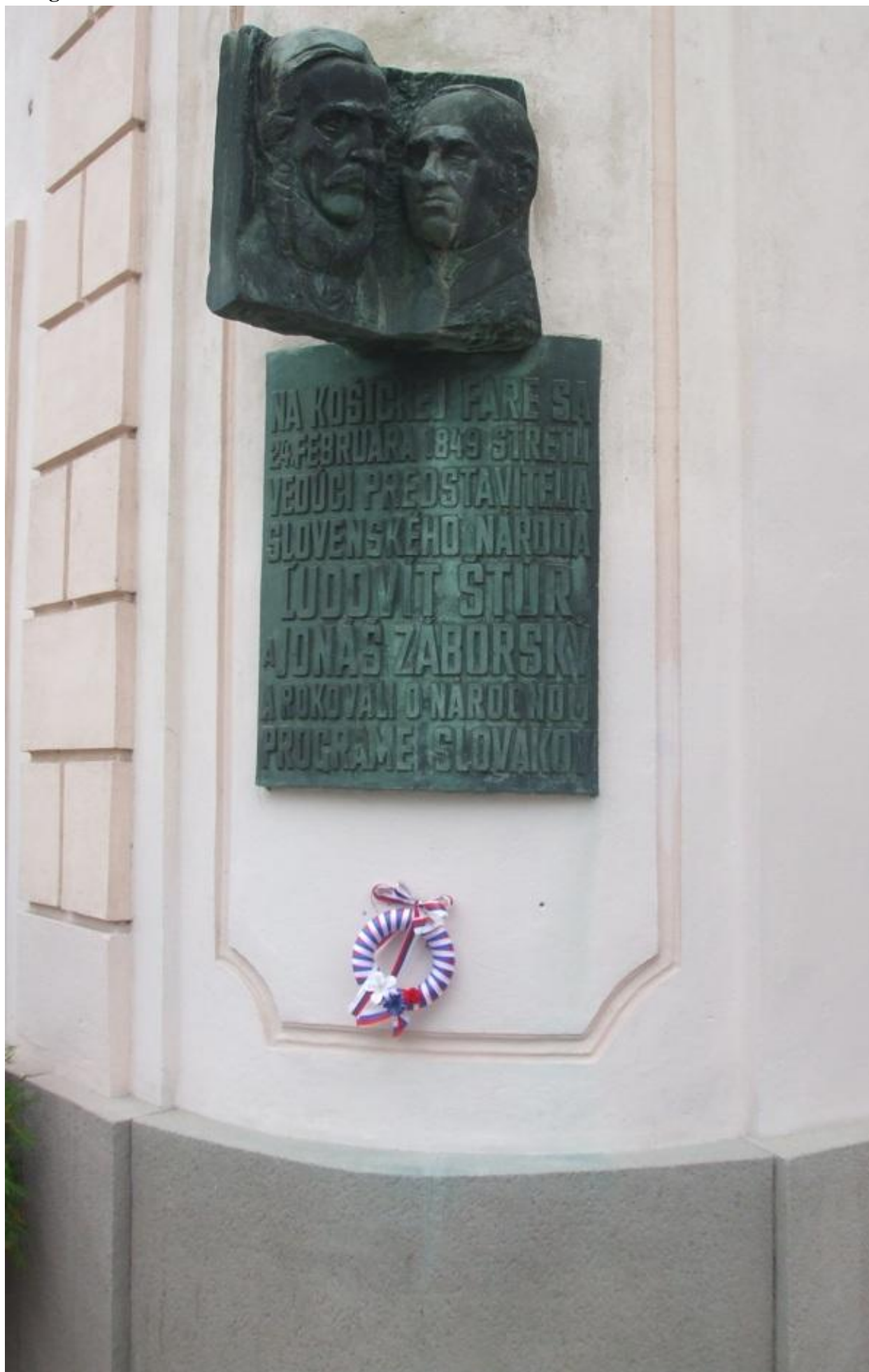
Foto 1: Košickí matičiari pripevnili venček pod pamätnú tabuľu venovanú dvom čelným predstaviteľom Slovákov