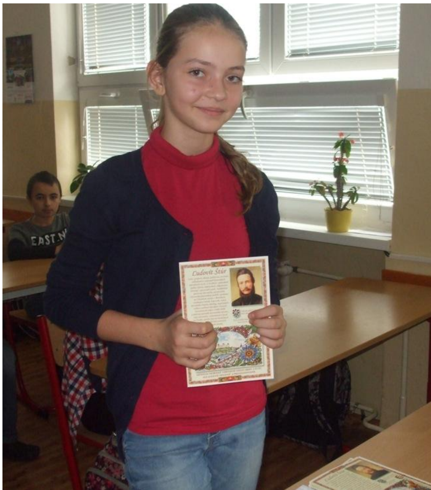
Foto 7: Odmenou za aktivitu bola aj tlačovina vytvorená pri príležitosti Roku Ludovíta Štúra