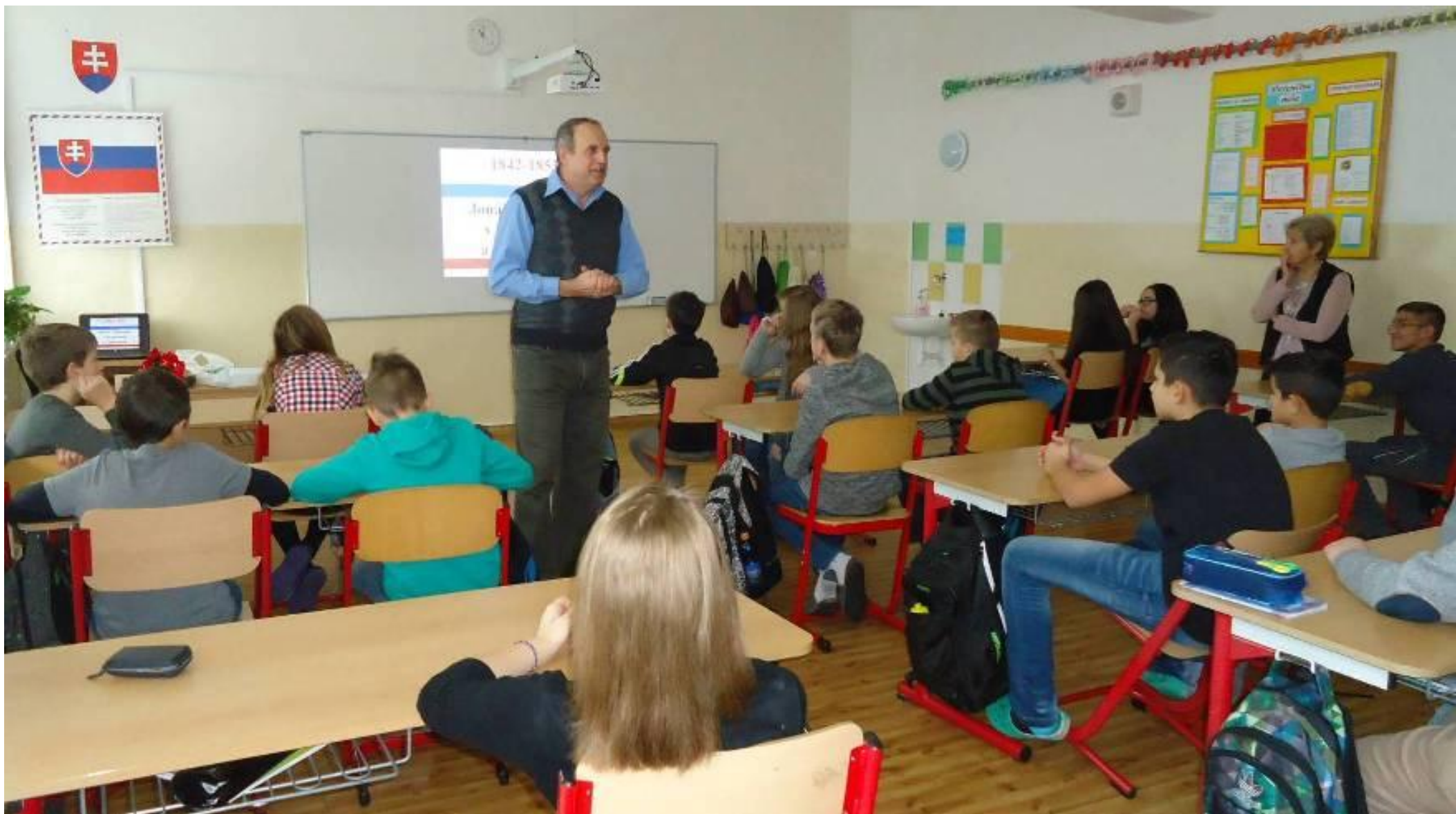
Foto 3: V útulných triedach vybavených najmodernejšou prezentačnou technikou bola radosť prednášať