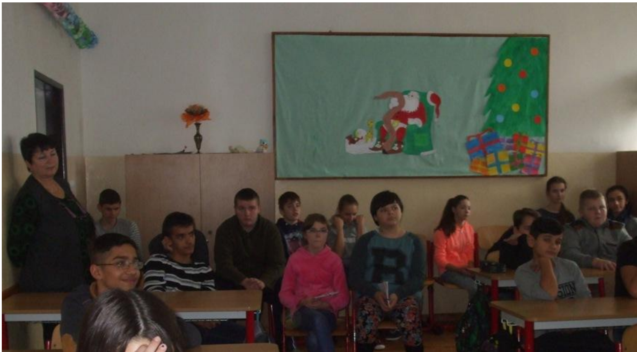
Foto 6: Celkom vyše 60 poslucháčov sústredene sledovalo prednášky