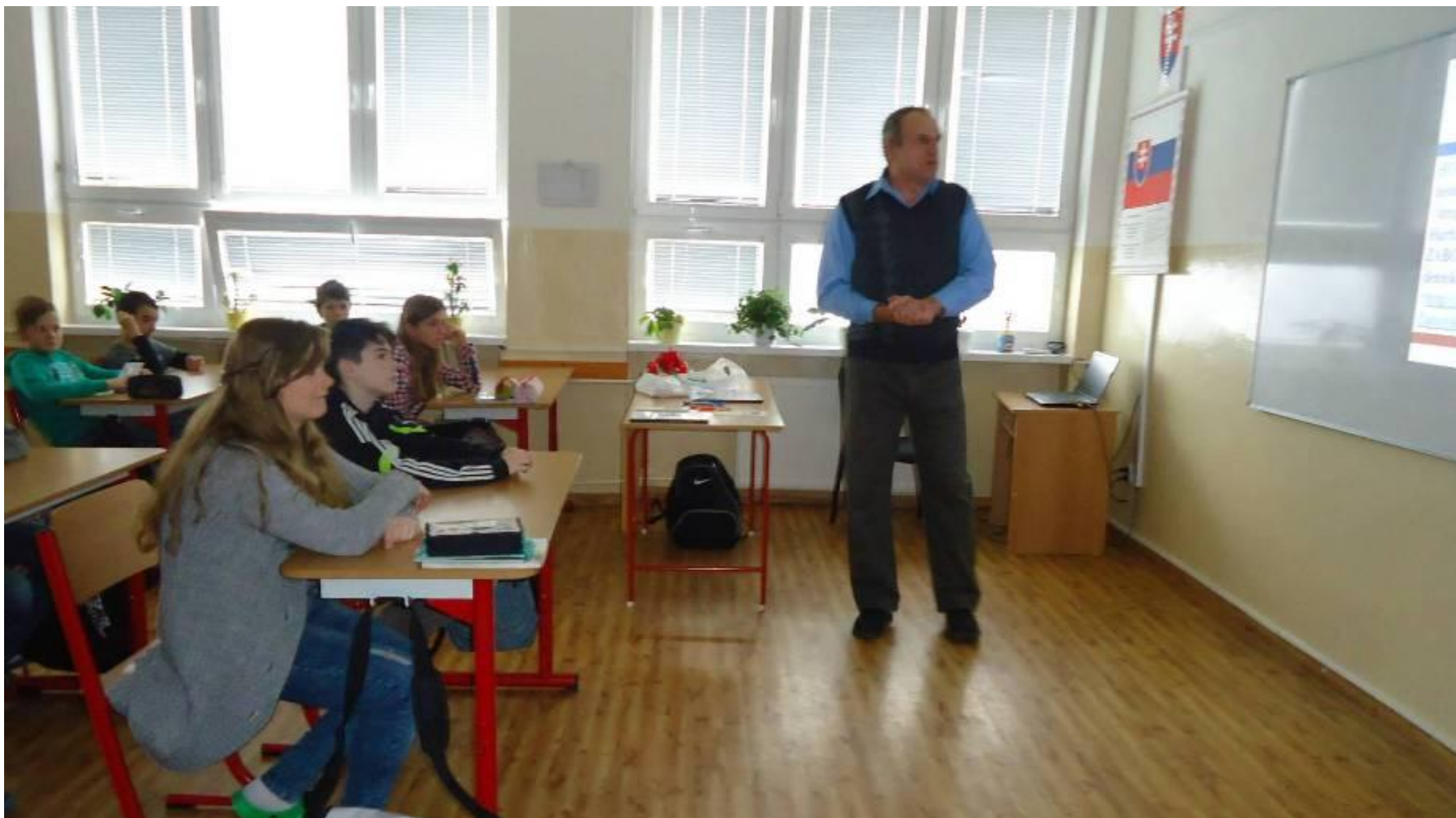
Foto 2: Prednáška s dvoma témami o rokoch meruôsmych v Košiciach a ich okolí zaujala žiakov 2.stupňa