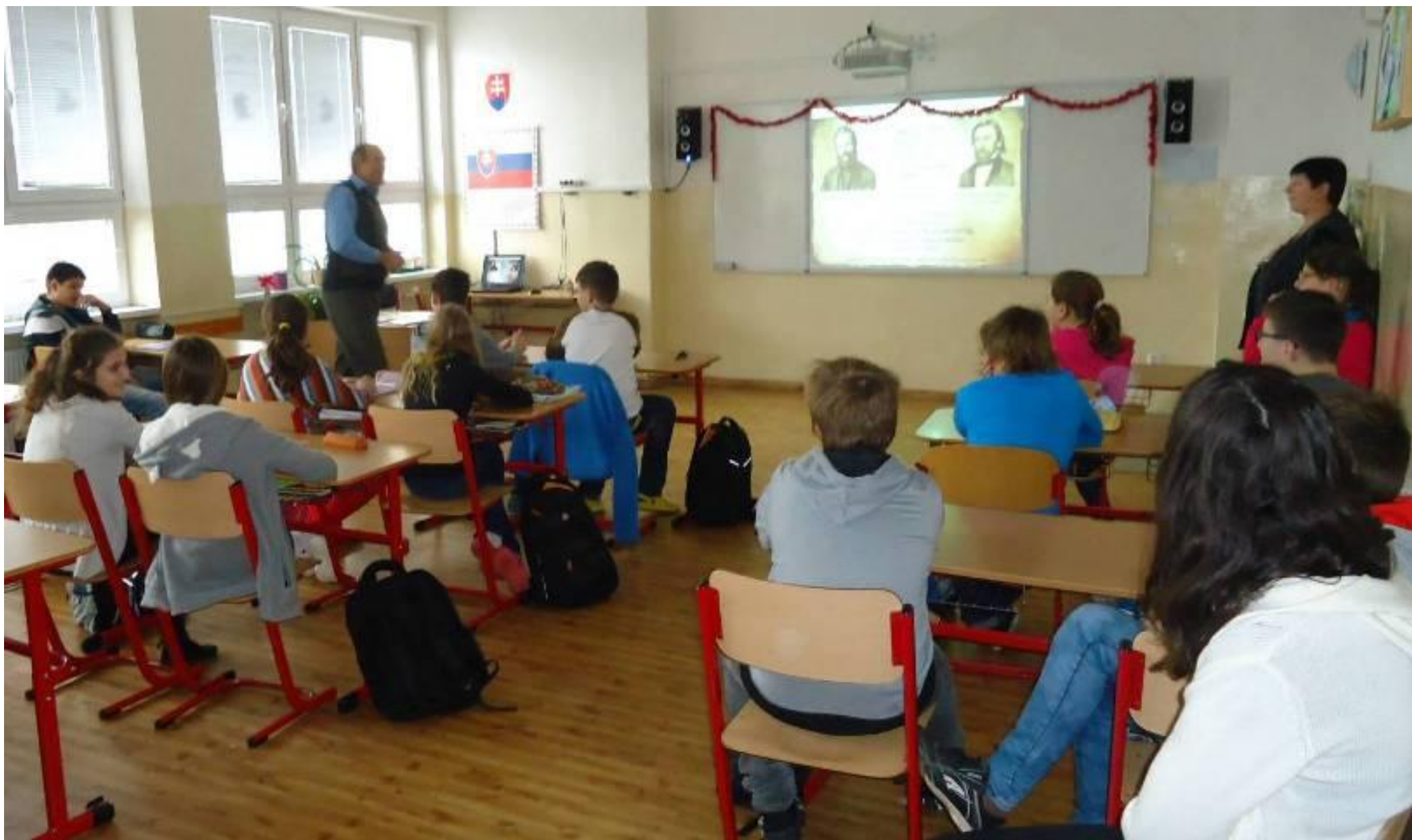
Foto 4: Žiaci sa dozvedeli, že aj dvaja významní predstavitelia Slovákov v rokoch 1848-49 s dobrovoľníkmi Slovenského národného vojska zavítali aj do obce Budimír