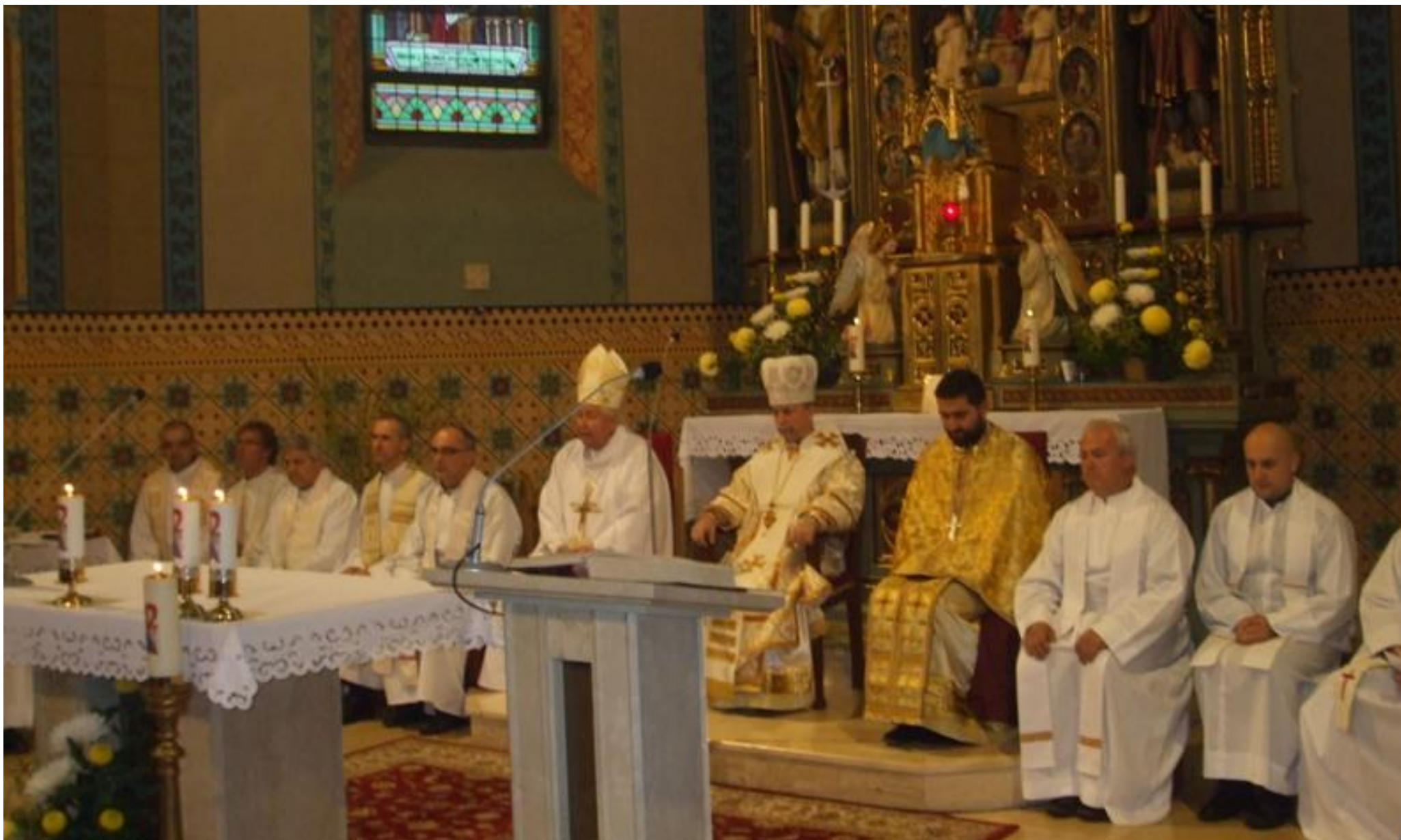
Foto 8: Hlavným celebrantom bol Jeho Excelencia otec arcibiskup Cyril Vasiľ, SJ, s početnými koncelebrantmi