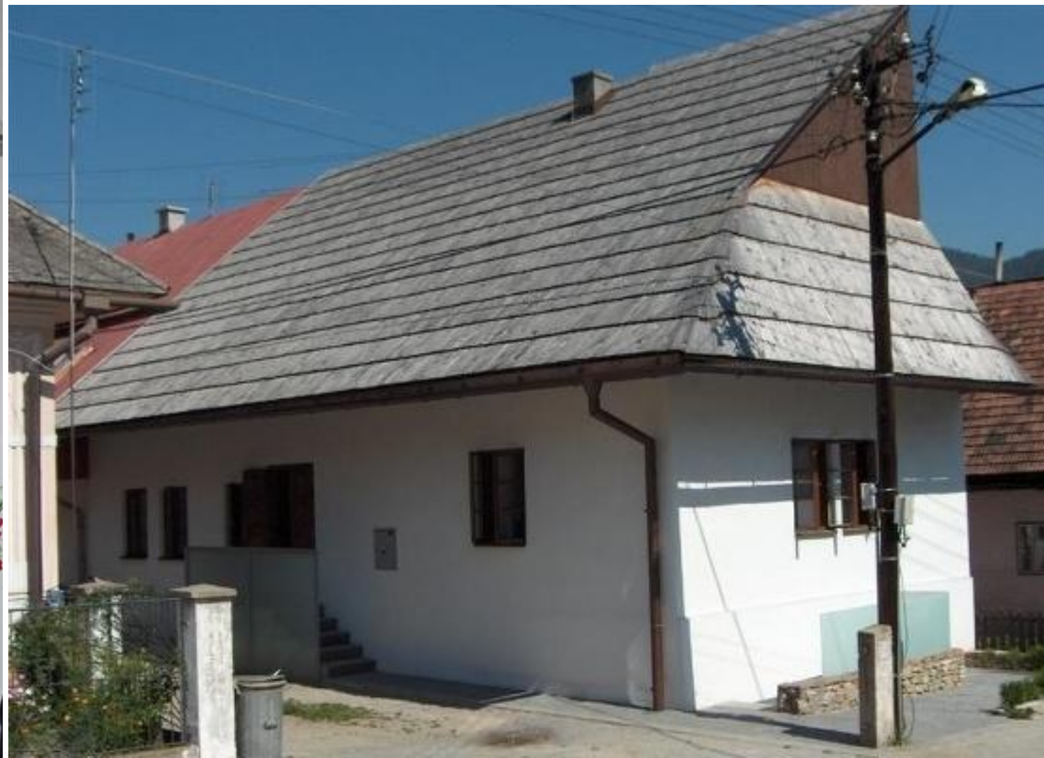
Foto 10: Malý venček košických matičiarov na rodnom dome Andreja Hlinku