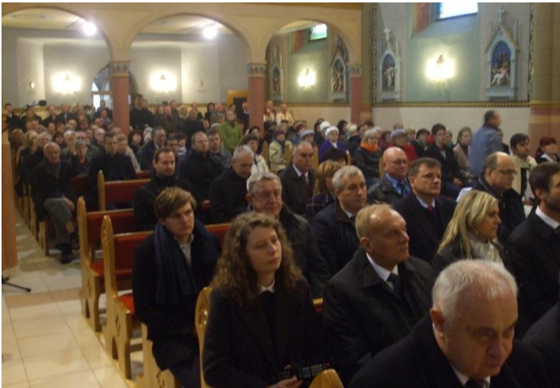
Foto 6: Kostol Panny Márie Ružencovej v Černovej sa pomaly zaplňal