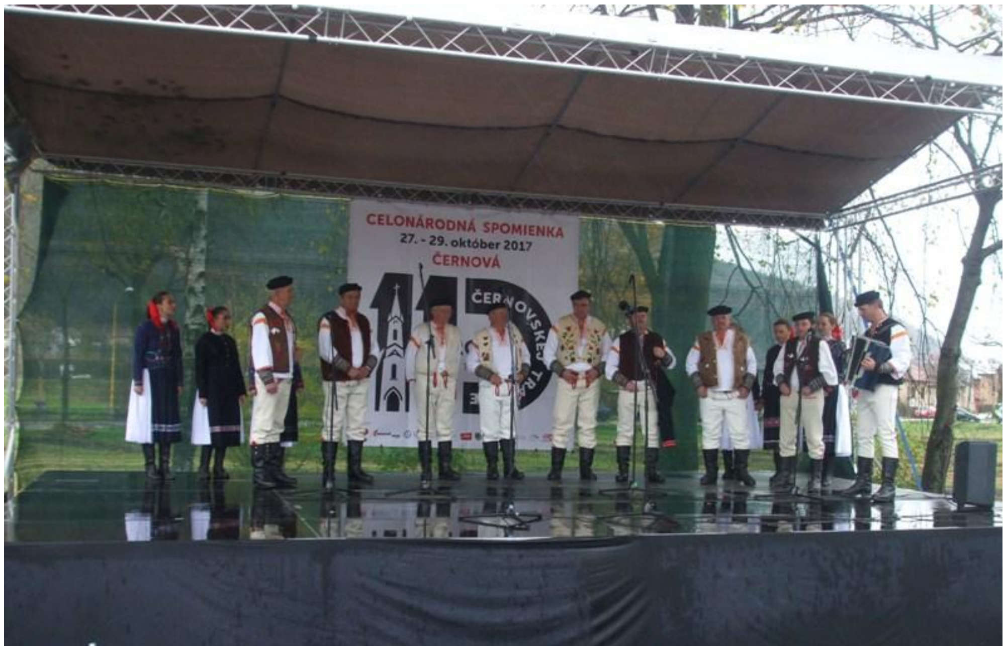
Foto 5: Spevácka skupina Chlapi z Dolnej Lehoty vystúpila v rámci programu