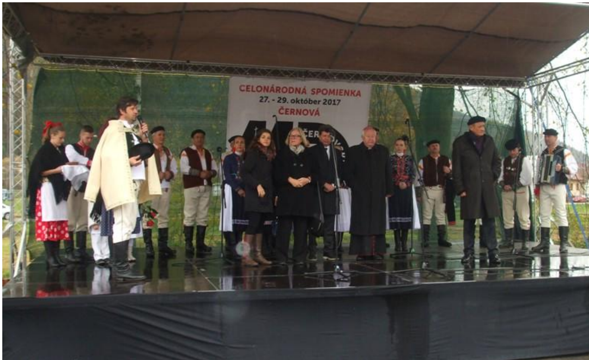
Foto 4: „Černovci“ vítajú vzácných hostí podujatia, medzi nimi aj Jej Exelenciu Ingu Magistad, veľvyslankyňu Nórskeho kráľovstva v Slovenskej republike