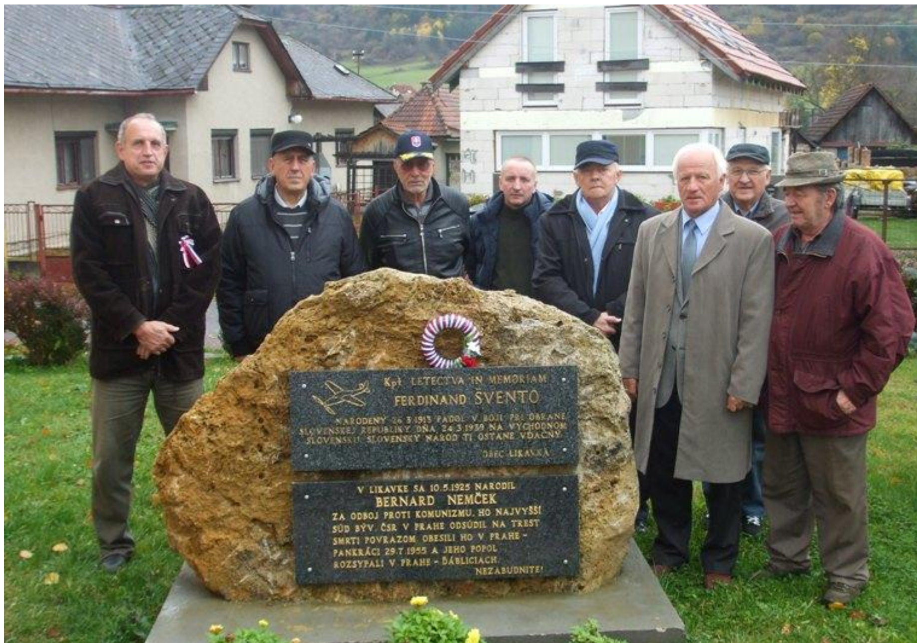
Foto 2: Košickí matičiari pri pamätníku kapitána letectva in memoriam Ferdinanda Šventa, pred Obecným úradom v Likavke