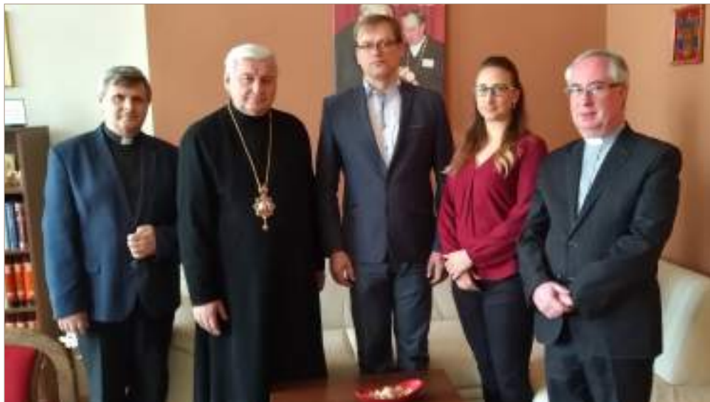
PRIJATIE MATIČNEJ DELEGÁCIE 22. JÚNA 2018 V PREŠOVE U ARCIBISKUPA JÁNA BABJAKA – METROPOLITU GRÉCKOKATOLÍCKEJ CIRKVI NA SLOVENSKU